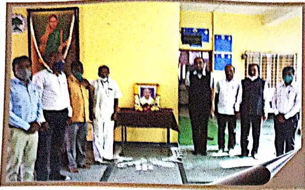
Late Hon. Jaykumar Patil Death Anniversary Celebration