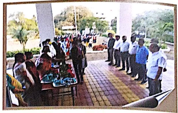
Mask Distribution to Student